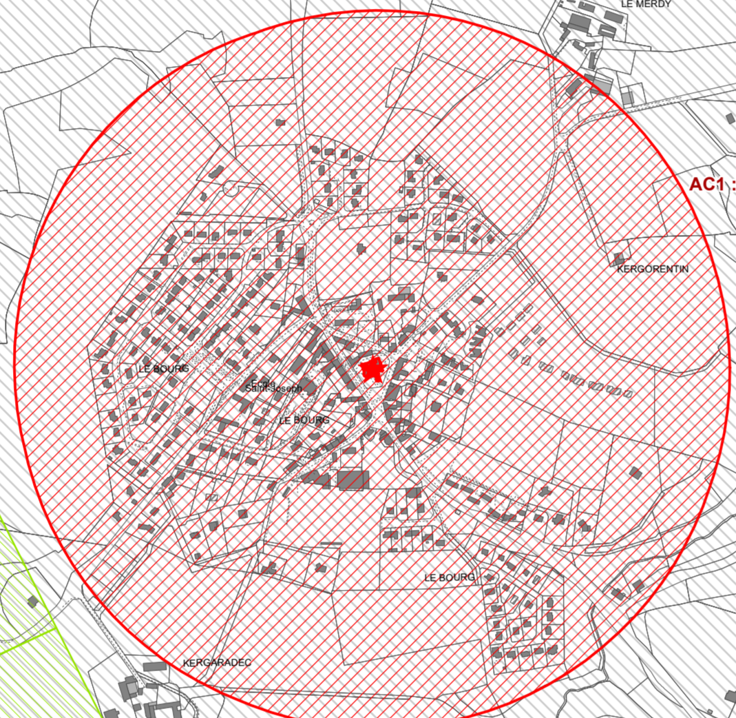
AC1 : Eglise et calvaire du bourg (Mhc)