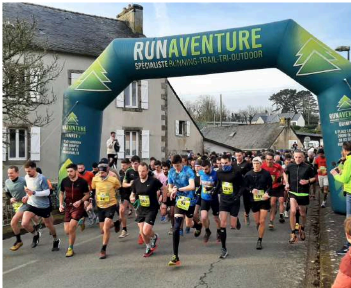
Départ du 15 kms

Le dimanche 16 février, l'association "Foulées Nature Gwengad" a organisé la 17ème édition de ses courses pédestres marquée par une affluence jamais connue jusque-là.