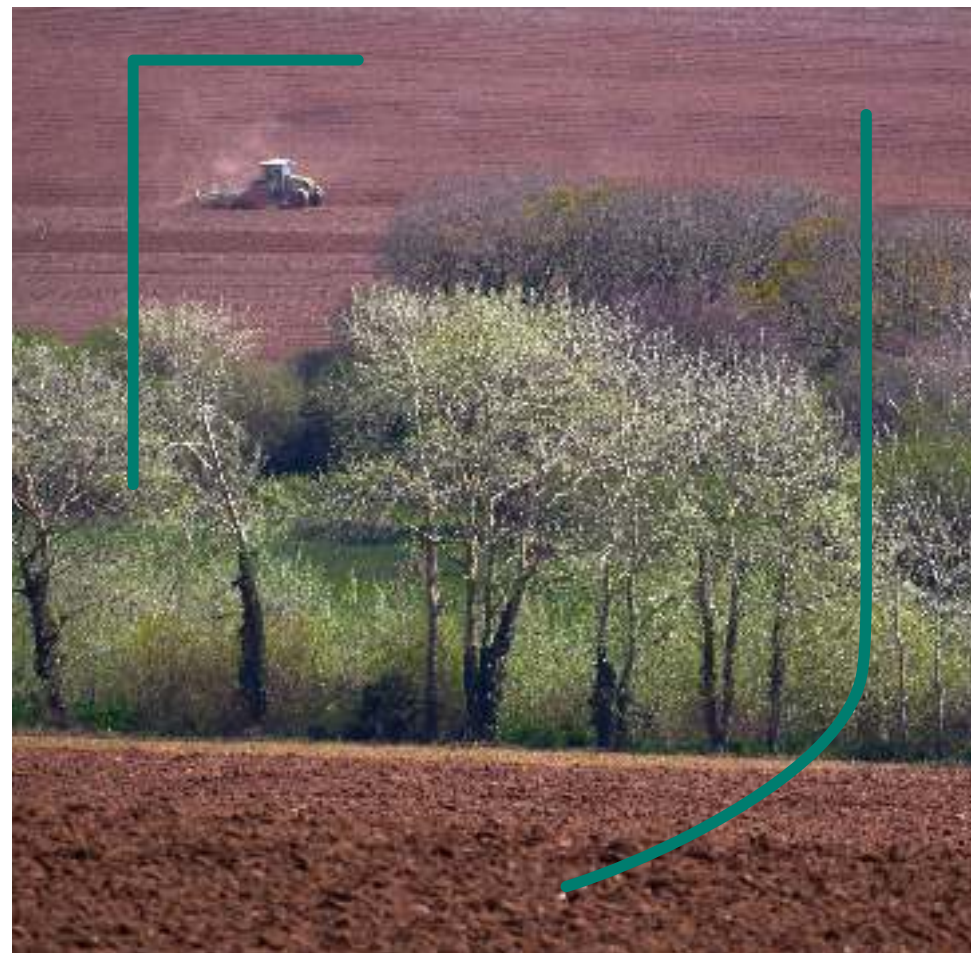
Département du Finistère - Source carto : ©IGN, BD CARTO, CHAMF/ODTM - Recensement agricole 2020 - Crédits photos : Chambre d'agriculture - Illustration : G&H Zales - Mars 2025